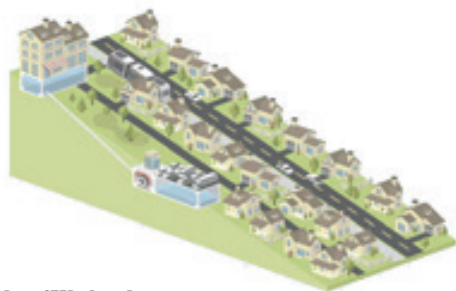
Projet STEP - Denis Payre