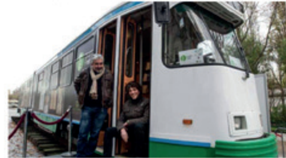
Des tram-trains en gare d'Alby pour des livraisons de marchandises.

Par Estelle Rochery France Bleu Saint-Étienne Loire Publié le 08 décembre 2015 à 10h30