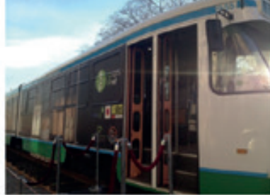
17 photos dans ce album

Local Environnement - 0812 - Cop21 - Transport